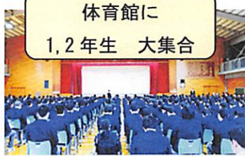
体育館に 1,2年生 大集合

1月22日(火)岩沼西中学校1,2年生を対象とした出前進路学習会を行いました。「充実した高校生活となるために」「各科・コースの学習内容」「中学生が参加できる進路行事」をテーマにコース代表の生徒たちが日ごろの学習内容を、スライドで説明しました。実演や作品発表もあり、中学生は見入っていました。高校生もその立派な態度に感動し、充実した時を過ごすことができました。岩沼西中学校の先生方のご協力に感謝申し上げます。