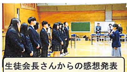
生徒会長さんからの感想発表

●中学生のアンケートから 高校選択の考え方が変わりました。 高校で何をすべきなのかわかりまし た。高校生の皆さん楽しそうでした。