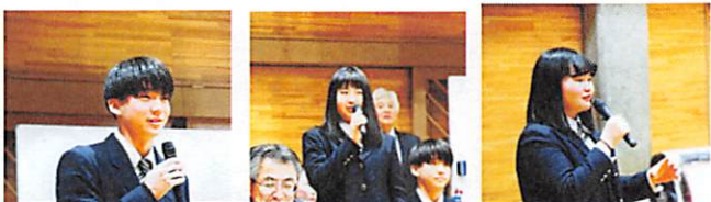
Q&Aコーナーで、中学生からの質問にユーモアを交えながら答えました。活発な質問ありがとう!